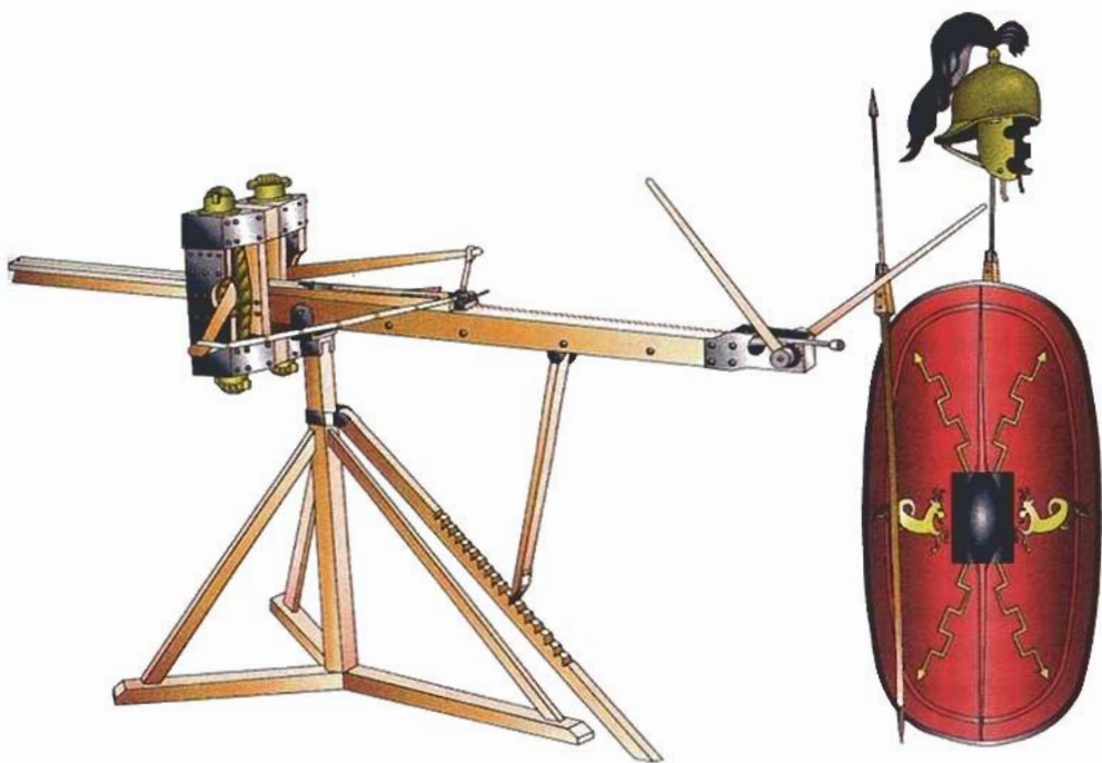
Fig. 4. Catapulta romana tipo «scorpio» y armamento de legionario de inicios del principado de Augusto (reconstrucción de E. Peralta).