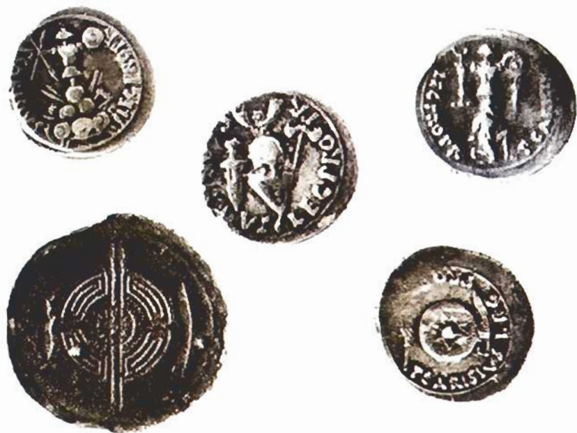
Fig. 5. Trofeos y despojos de guerra de armamento de los pueblos del Norte. Monedas acuñadas por cecas militares durante las guerras cántabras y por Carisio tras la victoria de la campaña del año 25 a.C. (Museo Arqueológico Nacional)