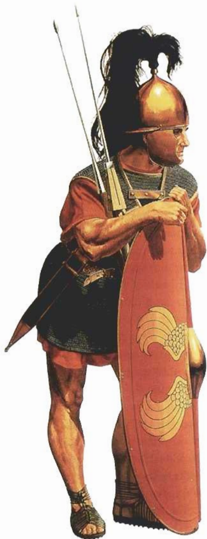
Fig. 1. Legionario romano de fines de la República. Reconstrucción del Römisch-Germanisches Zentralmuseum (Maguncia, Alemania)