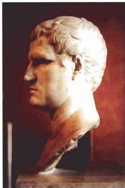
Fig. 2 y 3. Octavio Augusto y Marco Vipsanio Agripa. Bustos en el Museo del Louvre.